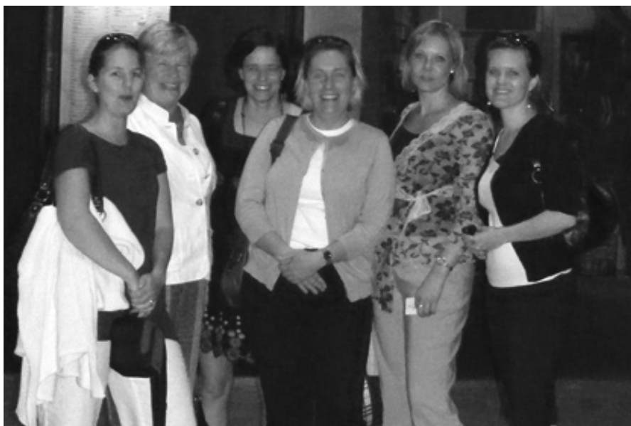
Glada (och mätta) Sweor. För andra Sweor som är sugna på italienskt så ligger Piola på 1550 Wilson Blvd, Arlington, VA 22209