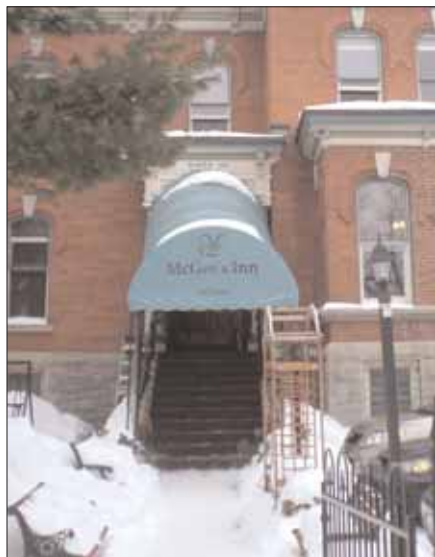
McGee's Inn välkomnar.

att kurret i magen krävde ett pit stop. Sagt och gjort, nästa avfart verkade bra, många snabbmatställen att välja mellan. För många visade det sig, eller i alla fall med namn som liknade varandra för mycket... Vart skulle vi, Arby's, Harveys, höger, vänster, rakt fram? Hoppsan sa, så var vi helt plötsligt på väg tillbaka till Toronto igen! Nej, nej, nej—det här var inte alls vad vi hade planerat! Tur i oturen var det inte långt till den tidigare avfarten och vi var strax på väg österut igen. Nästa gång vi passerade oturs-avfarten tog vi det säkra före det osäkra och svängde direkt vänster till McDonalds, och vid senare bensträckare (läs obligatorisk kaffepaus) så var vi noga att välja en avfart där man inte kunde