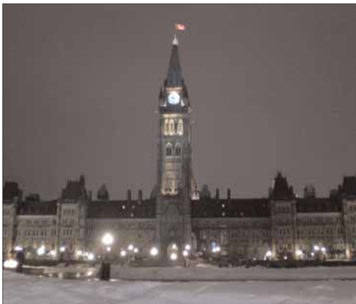
Parliament Hill fick ett nattligt sightseeingbesök av oss

skridskorna och pallrade oss iväg för en välbehövlig sopplunch. Lagom till att vi började tina upp så började även vädret ute att värmas upp så smått. Vi hade dock beslutat att Irish