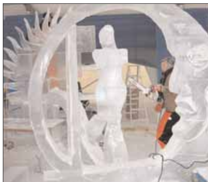
Fantasisfulla och vackra isskulpturer skapades under Winterlude festivalen.

korsa motorvägen. I efterhand skyller vi självklart allt på den förvirrade skyltningen och vägrar ta eget ansvar för fadäsen.