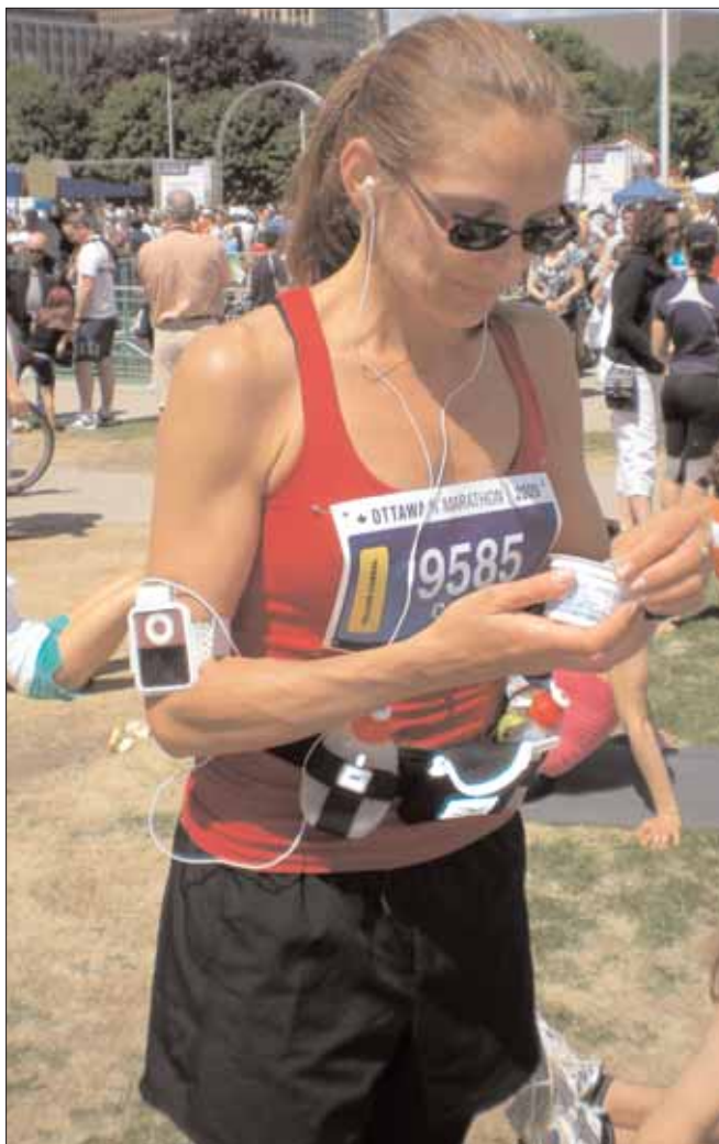
Proteiner är viktigt efter ett långlopp!

Motionsbiten blir vi med andra ord allt duktigare på. Och apropå det, Ottawa raceweekend gick av stapeln för några veckor