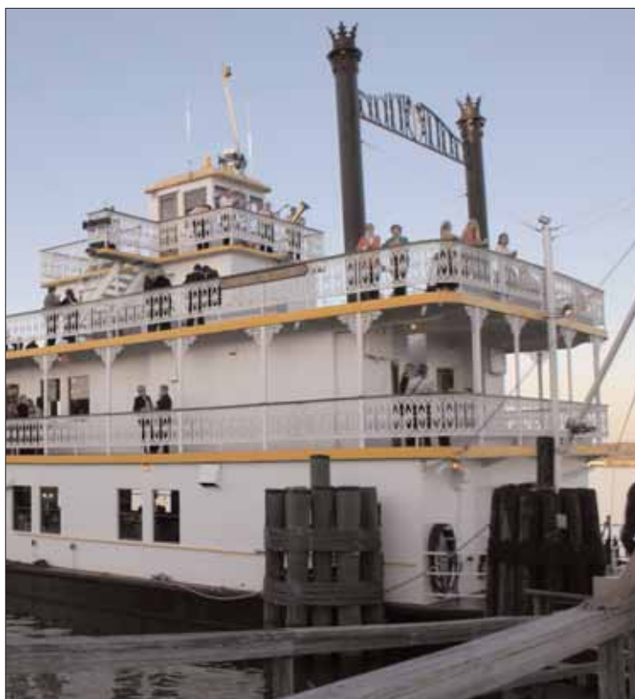
Paddle boat som SWEA åt och dansade på.