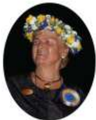
Manhattan Beach, March 26.2010

Kära alla SWEA och SWEA-avdelningar runt om i vårt globala SWEA-land,