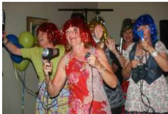
ABBAs Honey, Honey.

Kuhlmann och hennes festkommitté iförda glittrande peruker, hårtorkare till mikrofoner och stereoanlegget dundrade igång med