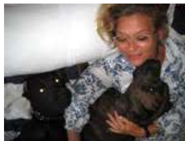
Jag och mina älskade hundar

Vi valde att bo ute på Godahoppsudden då vi behöver närheten till båda haven och njuter av bergen. Från att ha varit relativt lantligt när vi flyttade dit i slutet på 90-talet har det ändrats mer och mer till en förort, men vi trivs bra där – närheten till naturen och storstaden Cape Town är en fin kombination. Våra två hundar är en viktig del av familjen.