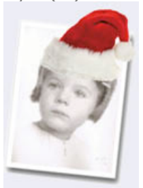
Christina Gourlaouen Grafisk produktion och distribution gourlaouen (at) gmail.com