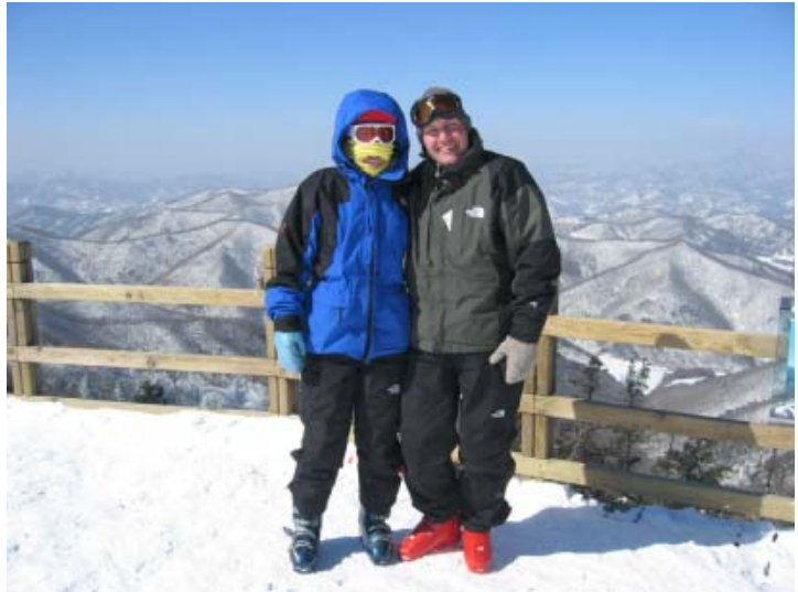
Påpälsad artikelförfattare jämte sambo i underskönt vinterlandskap.

YongPyong Resort har 31 nedfarter, 14 lifter och en gondola så utbudet tycker jag inte man kan klaga på. Den högsta toppen, Rainbow Top (1458 m) når man endast med gondola men även med sittlift kommer man upp till 1127 m höjd på Gold Top.