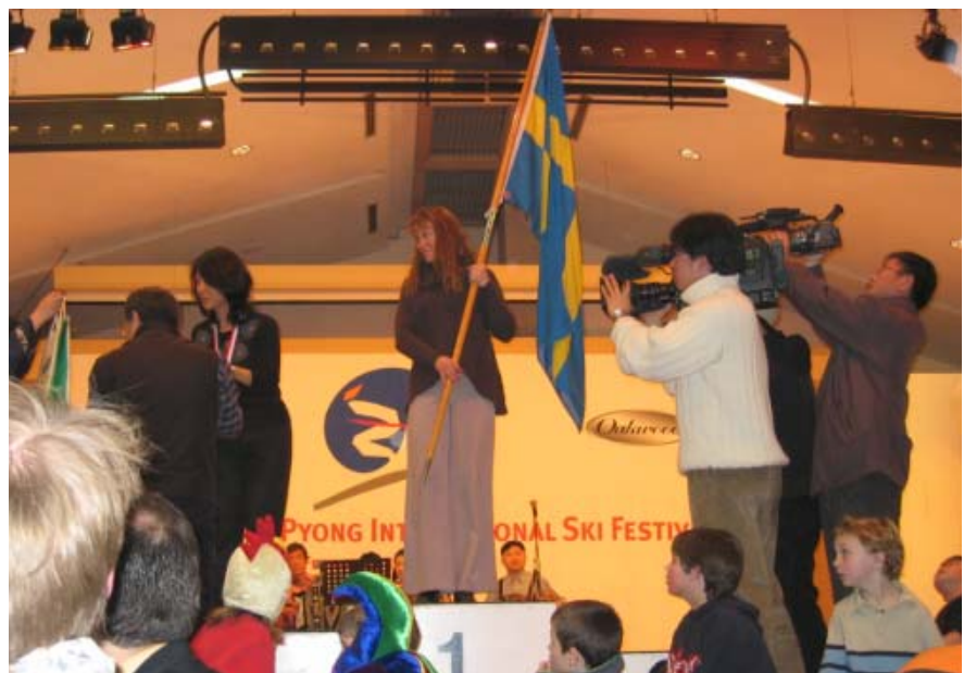
Artikelförfattaren, stolt guldmedaljör i längdskidåkning för damer!

YongPyong ligger inte långt borta (ca 2,5 h med bil utan köer) men känns ändå så långt från Seoul. Det är en