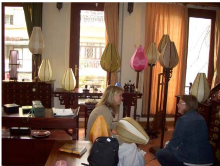
I valet och kvalet bland läckra lampor.

shoppingförberedda tjejer som tagit med den STORA resväskan.... Som packade sardiner, samt med en extra taxibil till bredden fylld med bl.a. mig, så kom vi fram till hotellet Hoa Linh beläget i de gamla kvarteren i Hanoi. När vi vaknade dagen efter och begav oss ut på den lite lätt guidade resan runt bland några sevärdheter, så möttes vi av en stad som myllrade av motorcyklar, damer med korgar över axeln, ett ständigt "oink-oink" från motorcyklarnas tutor. Ja, det var så mycket intryck på en och samma gång, så man blev lätt chockad. Jag har ju aldrig varit i Vietnam förr, vilket stämde in på fler av oss. Tydligt var trafiken lugnare i Hanoi än i Saigon, vilket får mig att undra över om det är möjligt... Sången "Hur ska jag göra för att komma över vägen?" nynnades i mitt huvud, när jag insåg att det inte är någon idé att vänta på grön gubbe. Vad är grön gubbe???? Nej, det var bara att gå rakt ut i gatan och hoppas på att motorcyklisterna, bilarna och bussarna snirkade sig vid sidan om oss. Detta var det mest fascinerade av allt. Vilket liv och vilken puls!! Klockan halv åtta på