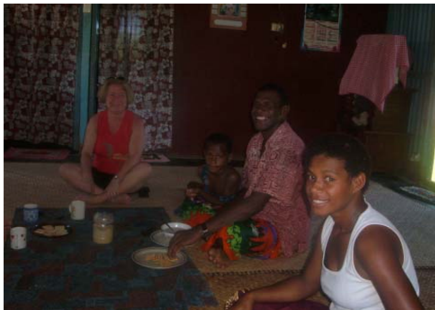
Artikelförfattaren beredd att hugga in.

Fiji, närmare än så här kan nog ingen resenär komma ett tropiskt paradiset. Med sina över trehundra öar omgivna av Stilla Oceanens smaragdgröna och alldeles kristallklara vatten är här underbart vackert. För många år sedan kallades öarna för Kannibalöarna på grund av invånarnas något annorlunda matvanor. Men oroa er icke! Fijianerna är