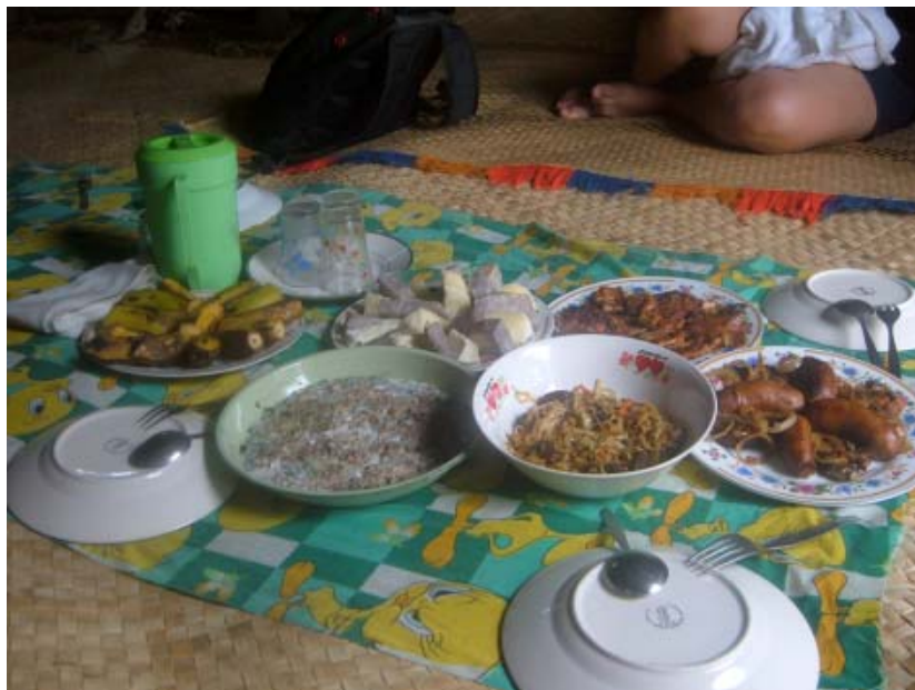
Diverse läckerheter redo att avnjutas.

Den som planterar en kokospalm, planterar mat och dryck, skålar och kläder, byggmaterial och ett bra arv till sina barn. Skulle du bli inbjuden till LOVO, en traditionell fest på Fiji, så tacka inte nej. Då får du äta mat som insvept i bananblad som grävts ner i en grop i marken och där upphettade stenar får det att puttra och ryka och sprida förföriska dofter bland de väntande