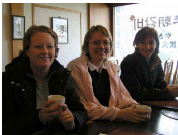
Sweor som trotsade vinterkylan och gav sig i kast med Itaewons smultronställen.