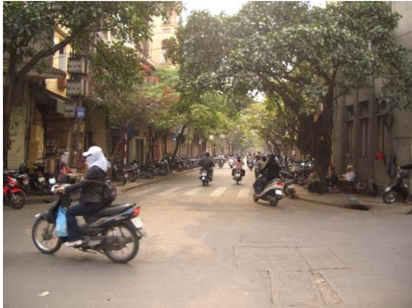
Myller av motorcyklar i centrala Hanoi.

Så var det dags igen, ännu en resa tillsammans med SWEA och Nordic Women. Den här gången packade jag väskan för att vara en av 12 som intog Hanois gator. Efter en berg- och dalbaneinspirerad flygning, landade vi i Hanoi och hämtades i hotellets minibuss, med betoning på mini... Visst, den rymde nog 12 personer, men då har de aldrig varit med om att hämta 12