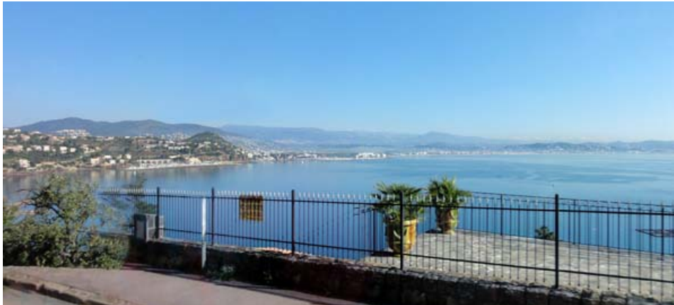
La Corniche d'Or, vy mot Théoule-sur-Mer, La Napoule och Cannes