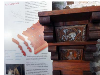
Ovan klostergården med sitt unikt bevarade trätak med hundratals medeltida detaljmålningar. Nedan amfiteatern, nu under tillbyggnad för en arena i nutida betong, inom de romerska lämningar.