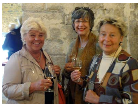
Vingodset Palayson visar upp av ägarna själva. Mycket tid och arbete ligger bakom utgrävning och restaurering av de ursprungliga byggnader.