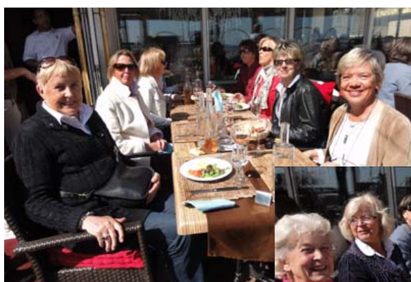
Lunchen intogs på en uteservering vid Saint-Raphaëls strandpromenad.