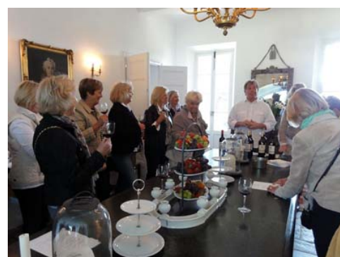
Vi besöker vinkällaren med sin gamla atmosfär och får även prova husets viner i den storslagna privata salongen.