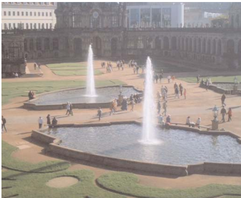
August den starkes "Festlokal", en gigantisk inbyggd park (bild 1)

Vi hann också med en film om den fantastiska återuppbyggnaden av Frauenkirche och ett besök i kyrkan. Det finns bara ett ord som är heltäkande: Otroligt! Nästan hela kyrkan var jämnad med marken, bara en liten bit av huvudingången stack upp (bild 3). Och efter drygt tio år av vad som antagligen måste ha varit världens största pussel eftersom de använde så många originalstenar som