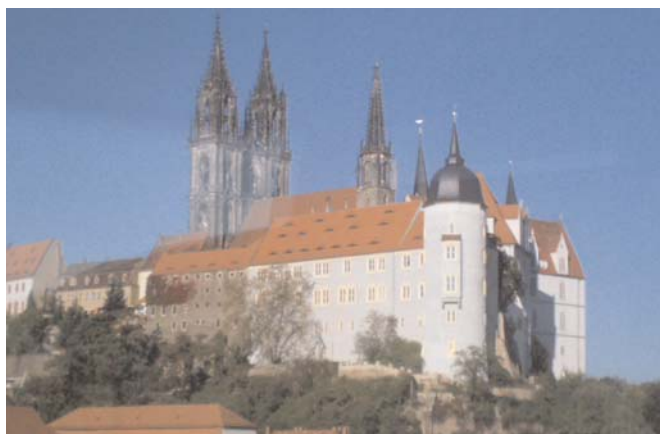
Meissen slott (bild 7)

möjligt, återinvigdes kyrkan 2004 (bild 4). Vad säger ni, skulle ni vilja försöka lägga det själva? Invändigt valde de att återställa kyrkan som den såg ut när den var ny och det ger en mycket speciell känsla av att titta på en gigantisk marsipantårta! För allting är som det var på 1700-talet, ljusst rosa, ljusst grönt och massor av