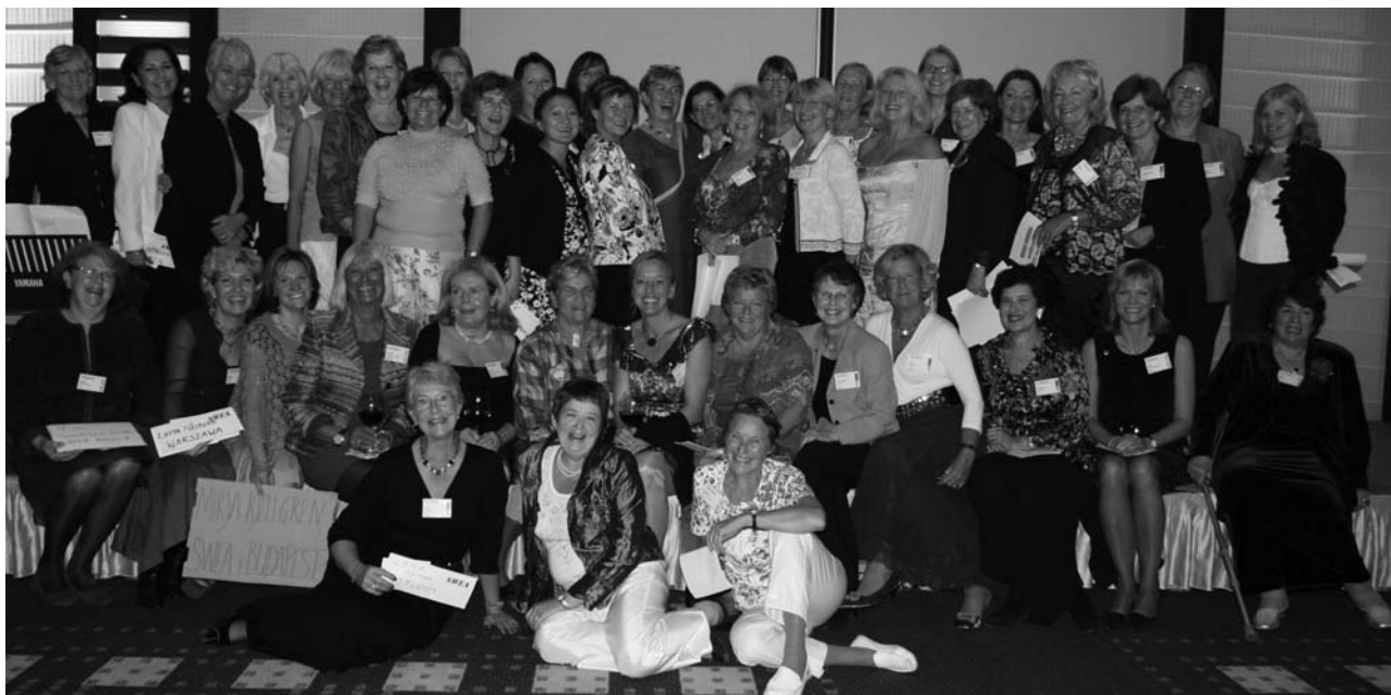
Ordföranden från de tre Europaregionerna samt SWEA Internationals styrelse.

Dusch på hotellet och buss till ett nytt, modernt bygge som innehöll alla de nordiska ambassaderna. Där bjöds vi på sekt (mousserande vitt vin), högtidliga tal av bl a vår nya