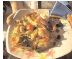
God mat och dryck