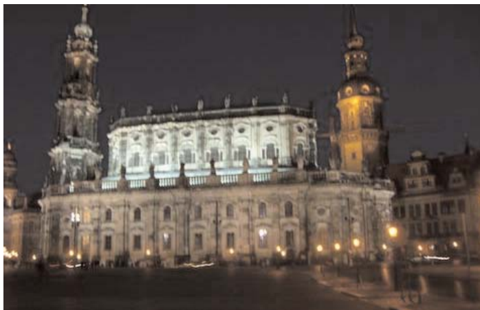
Katolska kyrkan i Dresden (bild 2)

Så jag vet mer om exempelvis Augusts oäkta barn, fester och andra krumsprång än om historiska byggnader. Låt mig ta några exempel: Detta är en bild av Augusts festlokal" (bild 1), fast det är bara en liten del som syns. Hans hustru drottningen hade tröttnat på alla sena fester så hon lät honom bygga denna diskreta lilla anläggning så att hon kunde dra sig tillbaka till slottet när