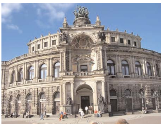
Operan i Dresden (bild 6)

vitt (bild 5), inte som de mörka kyrkor vi annars är vana att se. Så bara denna upplevelse är värd en resa till Dresden!