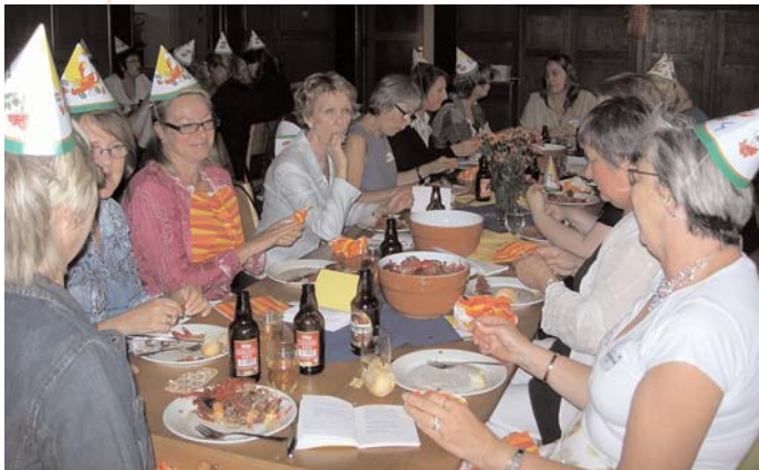
Glad stämning vid långbordet