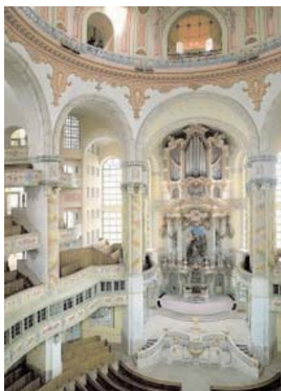
Frauenkirche invändigt efter återuppbyggnaden (bild 5)

möjligt, återinvigdes kyrkan 2004 (bild 4). Vad säger ni, skulle ni vilja försöka lägga det själva? Invändigt valde de att återställa kyrkan som den såg ut när den var ny och det ger en mycket speciell känsla av att titta på en gigantisk marsipantårta! För allting är som det var på 1700-talet, ljusst rosa, ljusst grönt och massor av