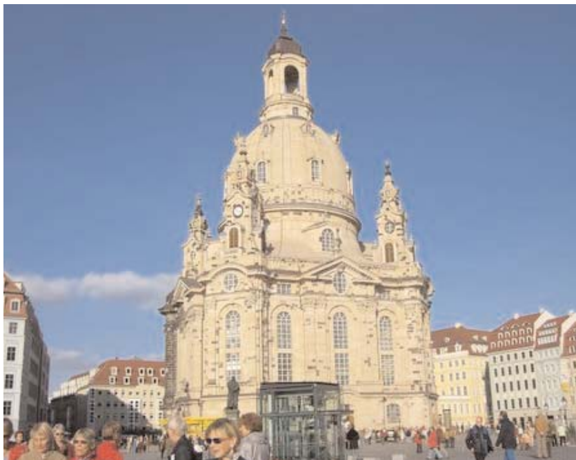
Frauenkirche återuppbyggd! (bild 4)