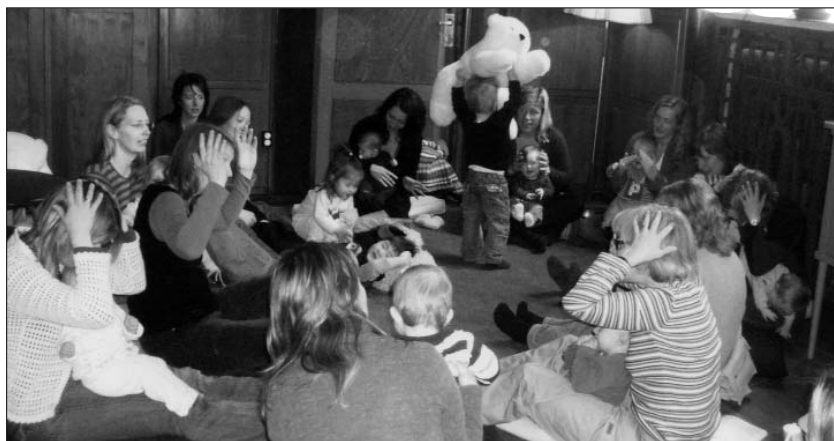
I ringen på blå mattan sjunger man både Imse Vimse och norska Pappas hatt på samma melodi, alla efter egen näbb och allt vad man förmår.