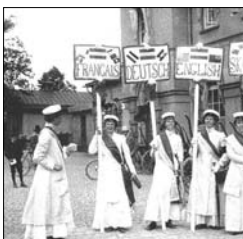
Internationell rösträttskongress i Stockholm 1911

Danmark, (och även Island som då tillhörde Danmark) antog år 1915 en ny grundlag, som gav kvinnor rösträtt.