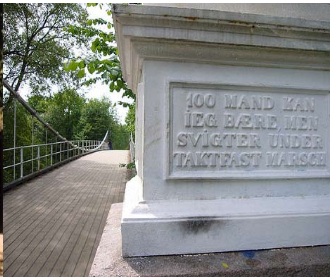
Åmodt Bru.