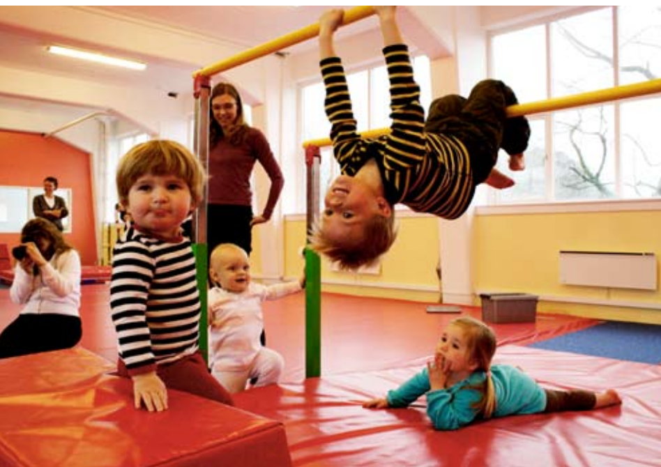
Full aktivitet på Little Gym

Det bästa sättet att få människor att involvera sig i något är att få dem att känna sig delaktiga, och utifrån det beslutades att den första träffen skulle bli en slags social sammankomst/ tämligen ostrukturerat arbetsmöte förlagd till Champagneria. Efter diskussioner hit och dit sändes ett antal inbjudningar ut till SWEOR som vi visste/ trodde/ antog tillhörde vår målgrupp (missade vi just dig så ber jag oändligt mycket om ursäkt, det var absolut inte med mening utan enbart för att vi faktiskt inte har några helt tillförlitliga listor. Ännu. Förlåt!). Hur som helst, ett tiotal SWEOR slöt upp till denna träff, då vi utöver att vi drack mousserande vin, åt gott och lärde känna varandra bättre, också spånade om saker som vi skulle vilja göra tillsammans. Mängder av förslag kom upp under kvällen, och sedan dess har det i stort sett bara rullat på av sig själv (näja, kanske inte helt av sig själv, men så väldigt svårt att administrera det hela har det inte varit, främst för att alla deltagare är så otroligt entusiastiska snabba att engagera sig).