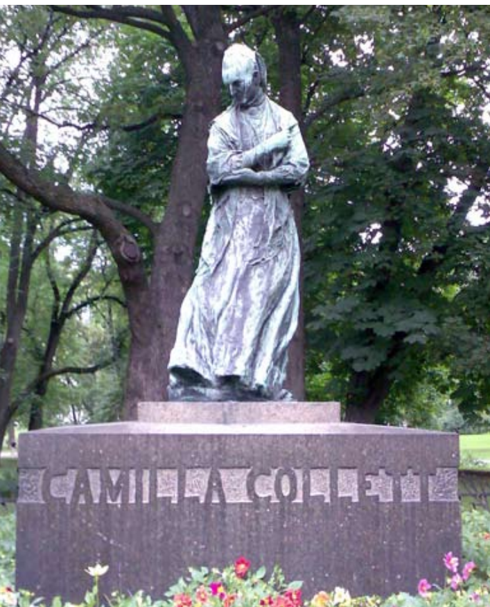
Gustav Vigelands staty av Camilla Collett i Slottsparken

Sweas "egen" guide, Sidsel Krokstad har tagit oss med på flera spännande turer i Oslo. Här är två vandringar jag själv följt: Homansbyen och längs Akerselva