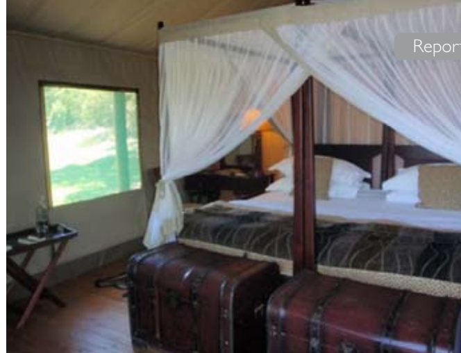
Insidan på vårt tält

av människor och live band, som spelade på kajen där Volvo Ocean Race-båtarna kom in. Ericsson-båten ledde etappen!