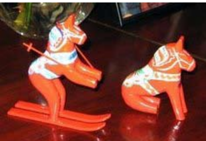
Herr och fru Dalahäst