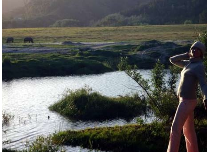
Eva tillsammans med våra "brovakthundarna", noshörningarna.