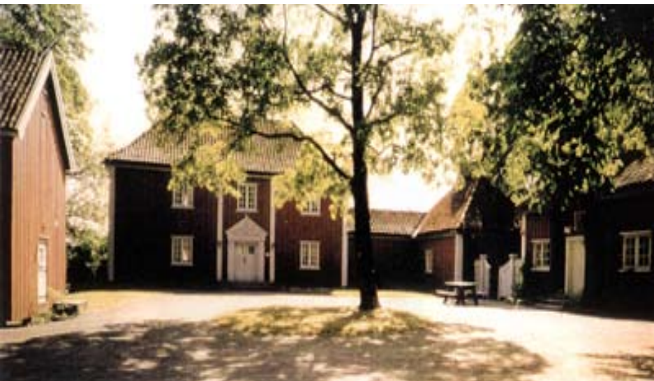
Vøienvolden gård, Sagene.