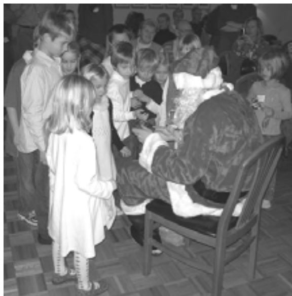
Tomten delade ut julklappar till alla barnen

Efter maten var det dags för luciatåget, framfört av SWEAs mamma-barngrupp. Vi åskådare samlades i sällskapsrummet där ljuset släcktes. Det var mycket stämningsfullt när mammorna och barnen tågade in sjungandes "Sankta Lucia". Några av de mindre barnen var lite otåliga och hade tjuvstartat lite – ett roande inslag.