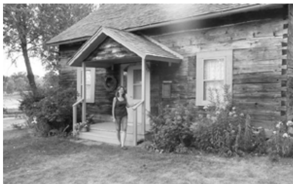
Gigi utanför det charmiga Prästhuset

Nästa byggnad vi besökte var Immigranthuset som är typiskt för den sorts hus där immigranter först bodde då de kom till Minnesota. På gården finns också ett mycket större hus, Prästhuset, som byggdes åt den första prästen i Elims församling. Medan det första huset var rätt rustikt och enkelt så var Prästhuset väldigt fint. Det var inrett som det skulle ha sett ut förr i tiden med möbler och även familjefotografier på väggarna. På den tiden var Prästhuset både prästens bostad och kontor. Prästen hade t.o.m. hållit vigselceremonier inne i finrummet.