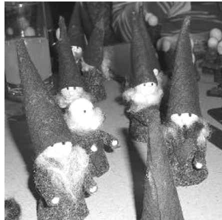
Tomtar på parad

Det fikades, pysslades, pratades och kvällen gick alldeles för fort. Tomtar tillverkades på löpande band och några flinka fingrar gjorde halmkreationer. Vi hoppas detta kommer ge lite klirr i kassan på Julfesten där de ska säljas. Pengarna kommer som vanligt gå till våra kommande stipendium och svenskrelaterade donationer.