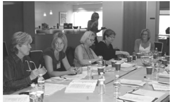
Regionmötet hölls på Exportrådet

gamla. Förslag som dök upp var att höra med nuvarande medlemmar varför man gick med i SWEA, och att höra av sig till gamla medlemmar om varför de inte vill vara med längre. Vi bor ofta i stora städer och har långa avstånd till varandra. Därför skulle det kanske vara bra att ha en kontaktperson i varje område för bl.a. samåkning och närkontakt. Ett ytterligare förslag var att det för småbarnsmammor skulle finnas barnvakt på mötena. Vad tycker du skulle göra SWEA ännu bättre?