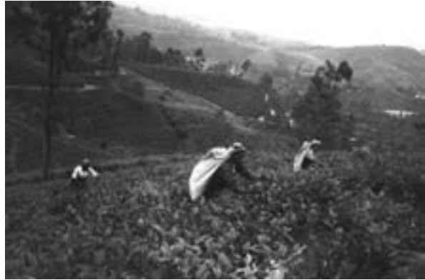
Teplockning i Sri Lanka

i landet. Vi förundrades över åsynen av alla barn i uniformer och att så många talade engelska.