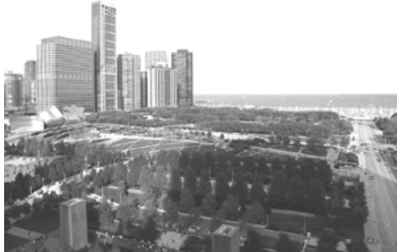
Utsikt från takterrassen på vårt hotel

Middagen avslutades med ett uppträdande av en väldigt talangfull Chicago Swea. Hon spelade piano och sjöng svenska visor, sedan lite jazz och till sist "Chicago, My Kind of Town." Helt underbart!