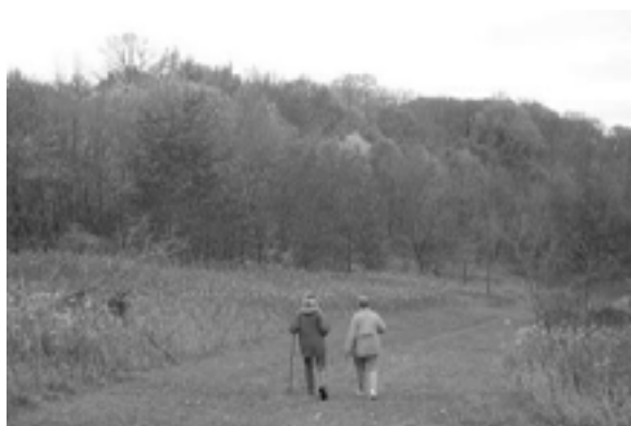
Eivor och Britt-Marie på Höstvandring

En höstdag 1 oktober hade SWEAs friluftsklubb höstvandring i Elm Creek park reserve. För första gången sedan friluftsklubben startade lyckades vi ordna någonting utan att vädret ställde till problem och vi var 3 SWEor, 2 män och 2 barn som hade en trevlig promenad bland gulnande löv. Efteråt njöt vi av medhavd lunch i det fria.