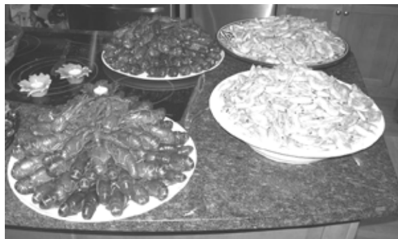
Det fanns gott om räkor och kräftor

Som tur var hade vi någorlunda fint väder och eftersom vi var så många fick några av oss sitta ute på altanen, insvepta i filtar. Det kändes som en riktig svensk sensommarkväll.