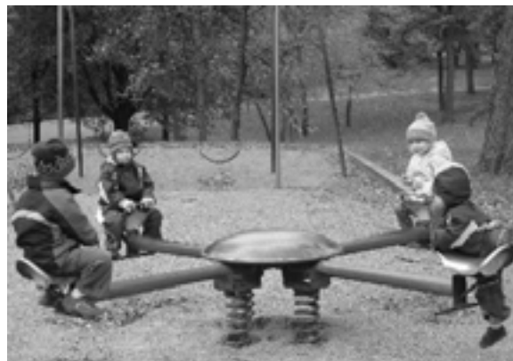
Höstklädda barn som åker gungkarusel

Barnen älskade att åka i den gamla lekparkens höga rutschkana och att klättra upp för den branta trappen och upp på plattformen som leder till rutschkanan. I och med barnens intensiva intresse för rutschkanan fick vi mammor röra på oss extra mycket, vilket var välbehövligt denna kalla dag.