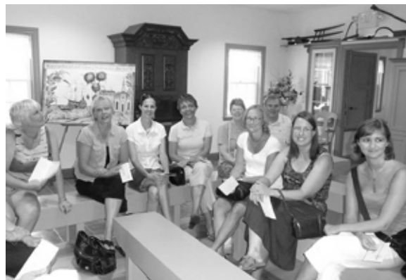
Först var det samling i "Välkommen Hus"

När man anländer ser man först en stor, fin gård med det typiska svenska timmerstaketet (gårdsgård). Vi kom in genom en lysande blå dörr till det nybyggda Välkomsthuset. Det ser ut som ett gammalt hus och rymmer bl.a. en butik, ett klassrum och en stor samlingslokal. Det är så gulligt dekorerat med dalmålningar, gamla möbler och andra ting.