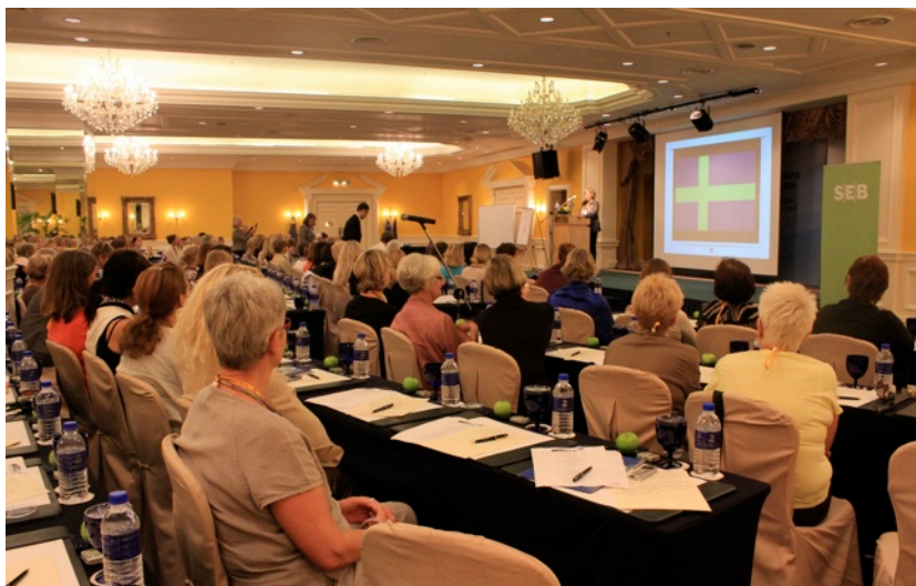
Världsmöteskonferens med intressanta föreläsningar på temat "Sverige i Asien."