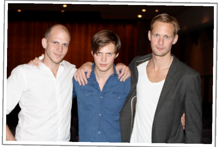
Bröderna Skarsgård, fr.v. Gustaf, Bill och Alexander