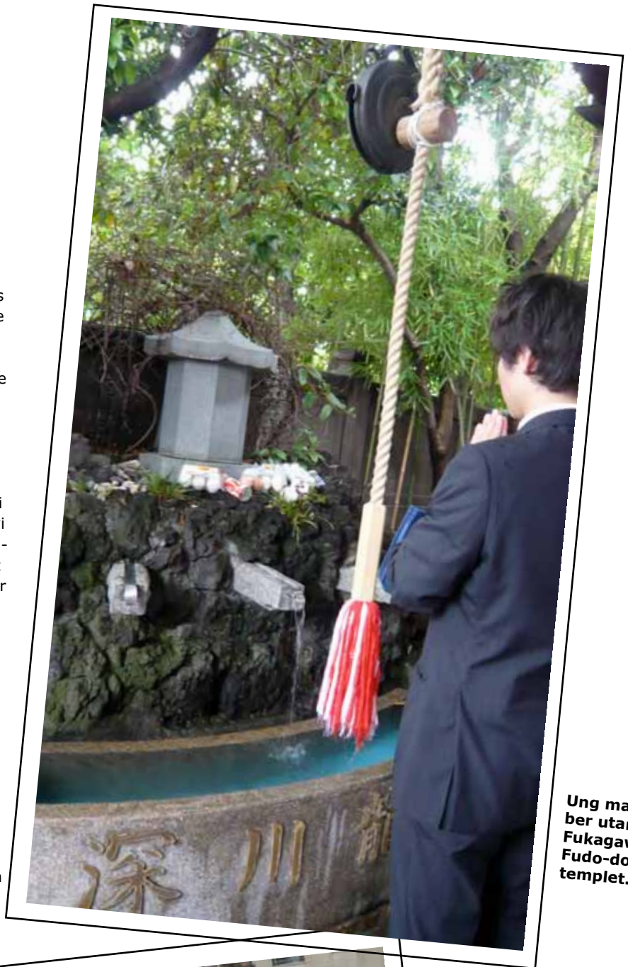
Ung man som ber utanför Fukagawa Fudo-do templet.