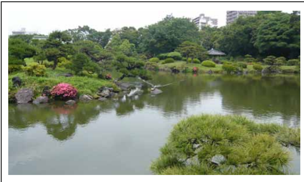
Fridfullt. Kiyosumi Teien Garden - mer känd som stenträdgård med sina olika stensorter som Iwasakifamiljen samlat på sig från hela Japan.

Text: Olivia Sesevic Juni 2009