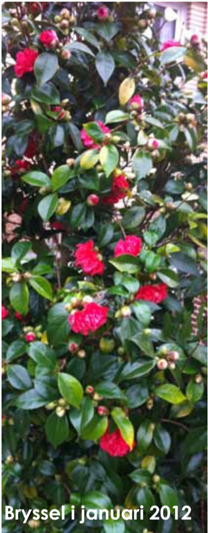
Bryssel i januari 2012

Det är med stor glädje vi presenterar det första numret av vårt nyhetsbrev i ny version. Vår ambition är att komma ut med minst 4 nummer per år och vi kommer att skriva om stort och smått samt uppmärksamma både SWEOR och vad som händer i Bryssel med omnejd och inte minst vad som sker i samband med våra spännande aktiviteter. Kom gärna med tips om vad du är intresserad av och vill läsa om i nyhetsbrevet!