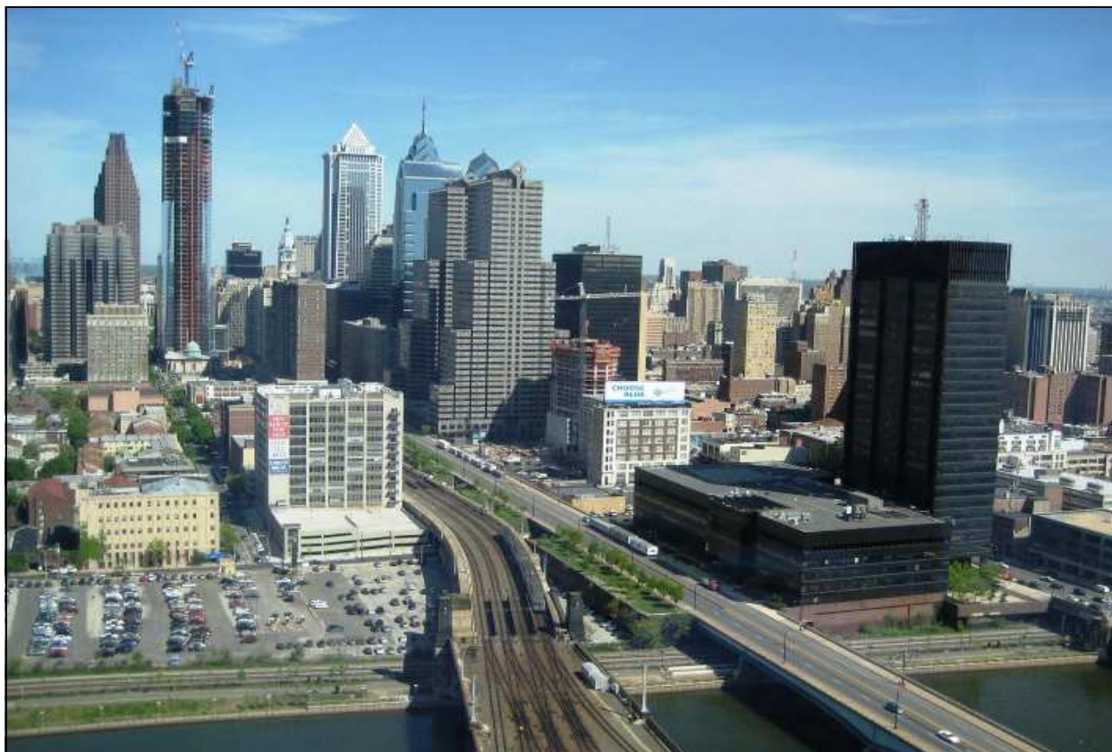
Utsikt över Philadelphia från SCA-skrapan