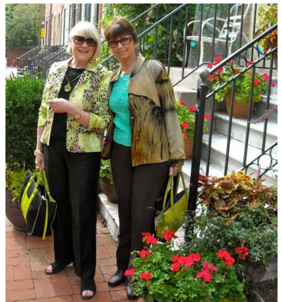
Ett gäng nöjda och glada Sweor på Powel House.

Powel House anordnar visningar, middagar, kvällar med musik etc.